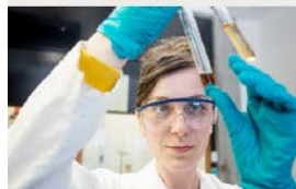
Gled deg til felt, programmering og eksperimentering.