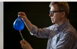
Få undervisning av fremragende forskere.